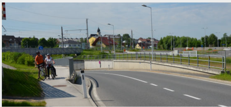
Das unbekannte Ende des Radweges

Neue Straßen sollen - wenn es nach den Radbeauftragten geht - einem Radverkehrscheck unterzogen werden. Denn bisher wurden die Radwege bei der Verkehrsplanung vernachlässigt. Fußgänger- und fahrradfreundliche Gestaltung von Verkehrswegen ist eine Frage des politischen Willens. Je mehr Menschen wir zum Fahrradfahren bewegen, desto besser ist dies für Umwelt und Gesundheit.