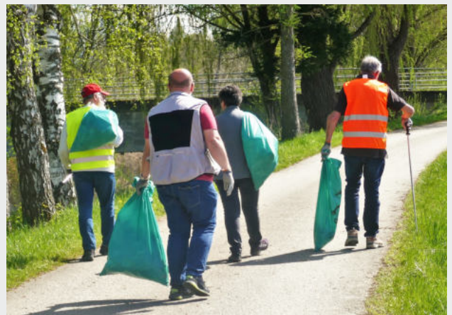
Nach der Flurreinigungsaktion durch die Saubermacher aus Rohr waren die Gehsteige und Wiesen nur kurz von Müll befreit.