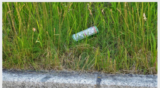
Aus dem Auto geworfene Dosen und Fastfood-Verpackungen liegen bald darauf wieder am Straßenrand.

Die SPÖ fordert seit längerem ein Rückgabe-Pfandsystem für Aludosen und PET-Flaschen. ÖVP und Wirtschaftskammer lehnen diesen Vorschlag ab, obwohl sich so ein System in anderen Ländern bereits bewährt hat.