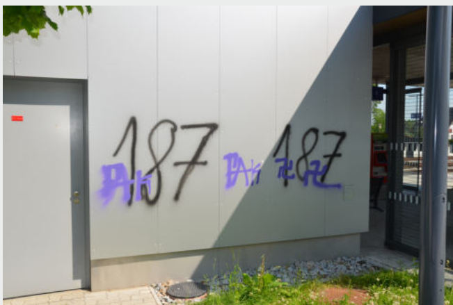
Vielleicht hilft im Bahnhofsbereich eine Überwachungsanlage, damit die Übeltäter gefunden und die immensen Reinigungskosten zurückgefordert werden können.