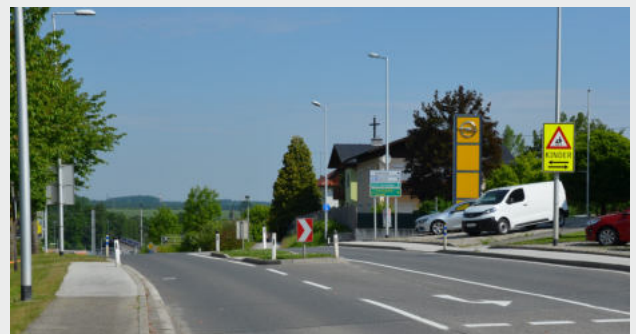
Die Gefahrenstelle bei der Überquerung der B139. Herannahende Kraftfahrzeuge aus der Unterführung sind nicht sichtbar.

Dieses Foto wurde an einem Freitag Nachmittag in der Unterführung in Rohr aufgenommen - an einer Stelle, wo einige Meter weiter Autos links abbiegen und das ohne eigene Abbiegespur!