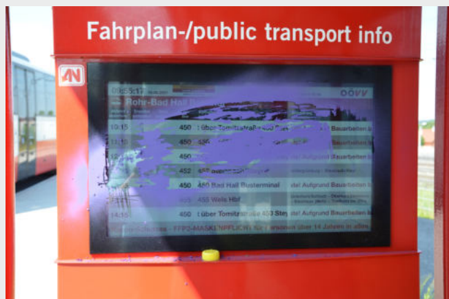
Beschmierungen mit ideologischen Sprüchen und Hakenkreuz sind in Rohr keine Seltenheit